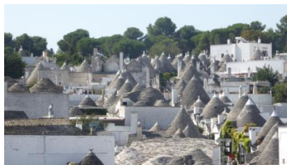
ALBEROBELLO : LES TRULLIS